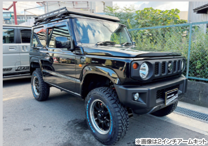
※画像は2インチアームキット