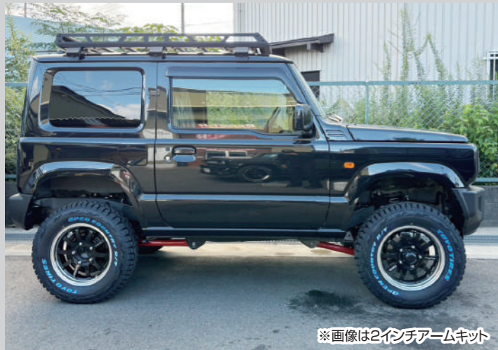
※画像は2インチアームキット