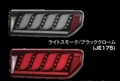
ライトスモーク/ブラッククローム (JE175)

リアラダー スチール製 ¥31,680(JE079) 穴あけ加工も必要なく装着可能。