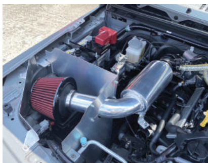
チャンバーサクションキット JB74 ¥52,800

JB74 ウィンチ仕様 ¥71,500 (本体、アンダーガード、ウィンチベット) ウィンチ無仕様 ¥69,300 (本体、アンダーガード、アッパーガード) JB64 ウィンチ仕様 ¥66,000 (本体、アンダーガード、ウィンチベット) ウィンチ無仕様 ¥63,800 (本体、アンダーガード、アッパーガード)