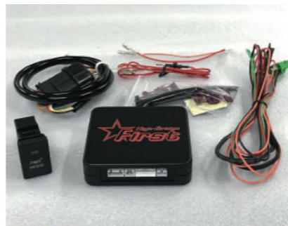
スロットルコントローラー (自動電源オンタイプ) JB64/74 ¥27,500

JB64用エアクリーナーのIN、OUT、 ジョイントホース、ホースバンド、 防振ゴムのセット