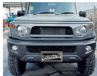
クラッシュフロントグリル FRP製 未塗装 ¥38,500

JB64用エアクリーナーパイピング、インター クーラーパイピングブローオフセット、ブローオ フリターキット、デザインブローオフフリター パイピングのパイピングフルセット、アルミ製。 純正エアクリーナー、純正インタークーラー用。 ブローオフバルブはスロットル前に移動。ブ ローオフバルブはトラスト製のオリジナルブラック