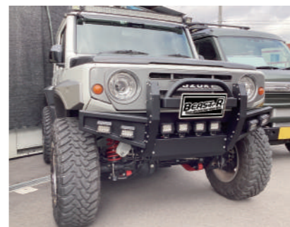
クラッシュ type T フロントバンパーセット JB74

JB64のエンジンは、サージタンクの無いエンジンです。サージタンクというのは簡単に言うと、アクセルを踏み込んだ際に各気筒へ素早く空気を送るための貯蔵タンクです。高回転でもこのサージタンクがあると、十分な空気を安定してエンジンに送ることができます。