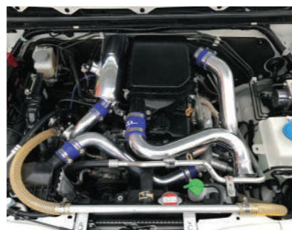
パイピングブローオフバルブ フルセット(HB1) JB64 ¥132,000

JB64用インタークーラーのIN、OUT、 ジョイントホース、ホースバンド、 ブローオフV2ブラック、ブローオフ用 ホース、純正ブローオフのメクラカバーの セット