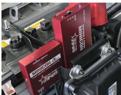
ミニコンフルセット(HB1) JB64 ¥55,000

ミニコン、ミニコンα、レスポンスジェットのセットです。ミニコンは燃料の噴射量ミニコンαは燃料の噴射タイミングの調整、レスポンスジェットはブーストアップとブーストの立ち上がりをよくします。安心してパワーアップできます。