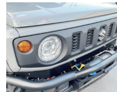
クラッシュ フロントエプロン