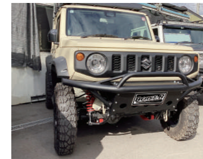
クラッシュ type TM フロントバンパーセット

JB74 ウィンチ仕様 ¥71,500 (本体、アンダーガード、ウィンチベット) ウィンチ無仕様 ¥69,300 (本体、アンダーガード、アッパーガード) JB64 ウィンチ仕様 ¥66,000 (本体、アンダーガード、ウィンチベット) ウィンチ無仕様 ¥63,800 (本体、アンダーガード、アッパーガード)