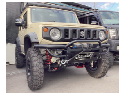
クラッシュ type Z フロントバンパーセット

JB74 ウィンチ仕様 ¥88,000 (本体、アンダーガード、ウィンチベット) ウィンチ無仕様 ¥77,000 (本体、アンダーガード、アンダーガードステー)