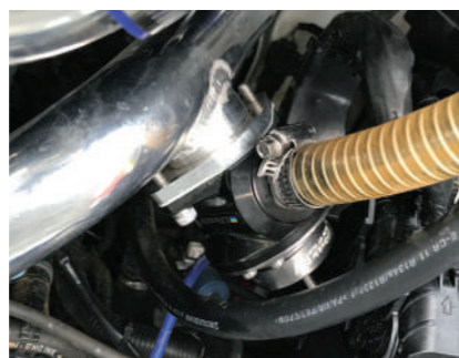
インタークーラーパイピング、 ブローオフバルブセット JB64 ¥77,000

ミニコン、ミニコンα、レスポンスジェットのセットです。ミニコンは燃料の噴射量ミニコンαは燃料の噴射タイミングの調整、レスポンスジェットはブーストアップとブーストの立ち上がりをよくします。安心してパワーアップできます。