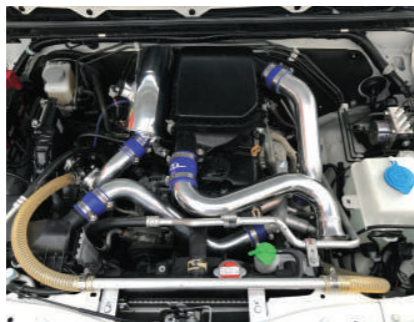
エアクリーナーパイピングセット JB64 ¥36,300

JB64用エアクリーナーのIN、OUT、 ジョイントホース、ホースバンド、 防振ゴムのセット