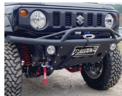
クラッシュtypeTMフロント用 純正フォグランプ取付ステー左右セット

スチール製 ¥108,130 アルミ製 ¥163,900 (本体、小型ワークライト8個) (別途 スイッチリレー ¥11,000) ワークライト無し スチール製 ¥75,130 アルミ製 ¥130,900