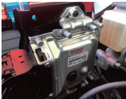
ハイスpekコンピューター クレーパー(HB1) JB64/74 ¥107,800