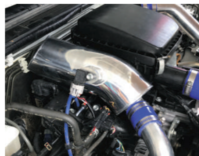
パワーチャンバー(HB1) JB64 ¥49,500

NAGバルブはエンジン内部に発生する圧力をコントロールし、常に大気圧付近に保つためのバルブです。大気圧付近に保つ事で、ピストン上下運動、クランクの回転運動などに加わる圧力による抵抗が減少し、ピストンもクランクの回転運動