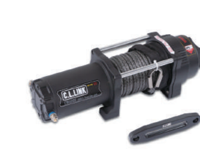
ウィンチ6000lbs(C.L.LINK) ファイバーロープ仕様12V ¥42,350

JB64にクラッシュフロントバンパー (typeT、typeTM)を装着する際に 必要なブラケットです。 純正フレームの先端をカットし、 ブラケットを溶接で取り付けます。