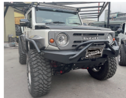
クラッシュ type ドラゴン フロントバンパーセット

1:オートモード 2:スポーツモード 3:レースモード 安全の為バックギアに入れると 純正制御に戻るようになっています