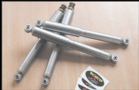
モンローロードマチック 2インチ/3インチ用 ¥60,060(JSU127) MONROE社製。基本性能と低価格を両立させたショックアブソーバー。フロント・リア共に純正ショックに対し、伸び側の減衰を多少強めているが、縮み側は純正よりも、ふたまわり大きいピストンバルブ(30φ)を採用する事により腰砕けせず、しっかりした乗り味を実現しています。