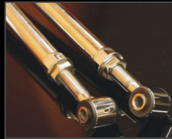
ステンスラテラルロッド フロント/リア 各 ¥25,300(JSU144) ステンレス製、調整式強化ラテラルロッド。