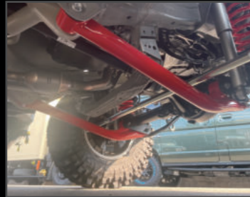
フロントリーディングアーム ¥60,720(JSU124) 2インチ用~5インチ用まで設定あり