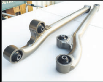
ZEROアーム フロント/リア各 ¥60,720 (JSU123)