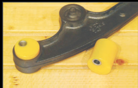
スペシャルキャスト 2個 ¥11,000(JSU138) 偏心量が大きいキャスト補正ブッシュです。純正アームで2インチ以上リフトアップする際は偏心ブッシュと交換をしキャスト角の補正をしましょう。