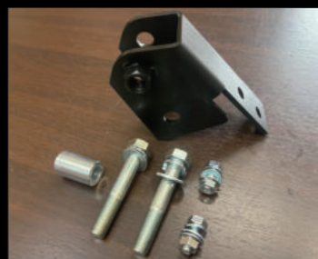
ラテラルアップブラケット ¥8,580(JSU168)