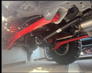
リアトレーリングアーム ¥60,720(JSU125) 2インチ用~5インチ用まで設定あり