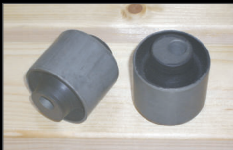
キャストープッシュ 2個 ¥8,800(JSU137) 純正アームのブッシュと交換することで角度補正を行います。コイルの弓なりを改善します。