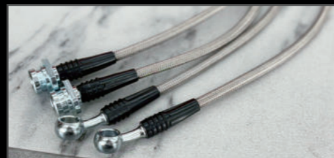
ステンレスブレーキホース ステンレス製 2インチ用 ¥17,600(JSU139) 3インチ用 ¥18,700(JSU140)