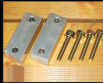
スタビダウンブロック 20mm ¥4,400(JSU151) 30mm ¥5,060(JSU152) 50mm ¥6,600(JSU153) リフトアップ時のスタビリンクの角度を補正します。