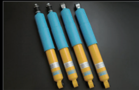
ビルシュタイン JB64用 ¥117,700(JSU128) JB74用 ¥126,500(JSU129) JB64/74特有のピッチングやロールを完全に解消しながらめらかな乗り心地のよさを両立したダンパーセットです。ノーマルスプリングとの相性も良いです。