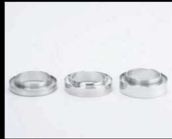
コイルスパーサー アルミ製 10mm ¥5,390/枚(JSU148) 15mm ¥5,720/枚(JSU149) 20mm ¥5,720/枚(JSU150)