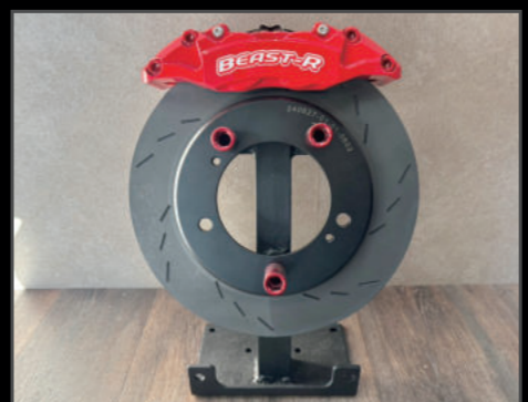
クラッシュ 4ポット キャリパー ビッグローター キット JB64/JB74/JC74 ¥275,000(JSU169) ビーストアールオリジナルブレーキシステム。当社レースカーで過激なテストを繰り返したハイパフォーマンスブレーキシステムです。キャリパー部分のロゴは白/赤と黒/黄の2色より選択可能。