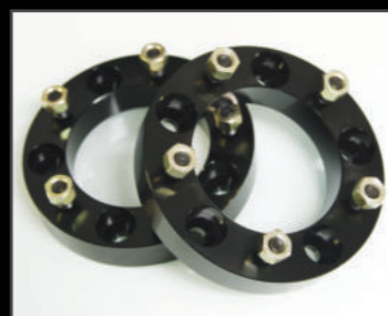
ワイドトレッドスパーサー PCD139.7 5H 2枚セット 20mm ¥11,000(JSU158) 30mm ¥13,200(JSU159) 40mm ¥14,300(JSU160) 50mm ¥15,400(JSU161) 60mm ¥16,500(JSU162) 70mm ¥17,600(JSU163)