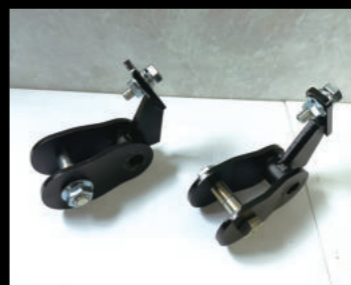
フロント ショック延長ブラケット 70mm ¥13,200/2個(JSU164) 50mm ¥12,100/2個(JSU165)