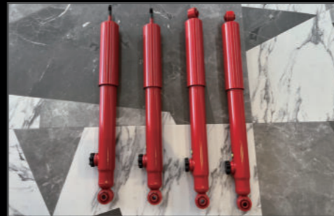
14段階調整式ショック 3インチ ¥88,000(JSU130) 2インチ ¥83,600(JSU131)