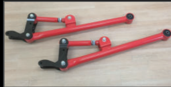
リアMOリンクキット ¥148,500(JSU126) ホーシング側にブラケットを装着し、ブッシュを片側4カ所にする事で、ストロークや擦れは純正の比ではないくらい良く動く足に変身します。アッパーアームが調整式になっているため、コイルの弓なりも補正でき、乗り心地も良くなります。5リンクでは気になるロールやワインドアップも、このMOリンクでは気にならない程度です。