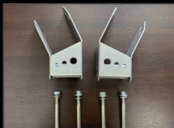
メンバークリアランスブラケット 4~5インチ対応 ¥15,950(JSU134) リフトアップ時のクロスメンバーとプロペラシャフトの干渉を防ぐブラケットです。