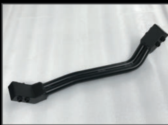
エスケープメンバー 3インチUP ¥24,200(JSU132) 2インチUP ¥22,000(JSU133) 車高アップした際の必需品。プロペラシャフトが当たらないメンバー。ダブルパイプ式で高強度。構造を工夫する事で地上高を下げず、オフロードも安心して走行できます。車検対応。脱着式のため構造変更不要。脱着式のメンバーですが外すと車検には通りません。スチール、半つや消しブラック塗装。