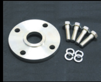
プロペラシャフトスパーサー ¥9,900(JSU156) リバンド時のプロペラシャフトの抜けを防ぎます。3インチ以上のリフトアップは必須