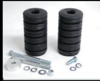
大容量パンプ フロント 2個 ¥9,240(JSU154) リア 2個 ¥7,260(JSU155) カッターナイフで切れるので好みの長さに調整可能です。ショウワガレージ製