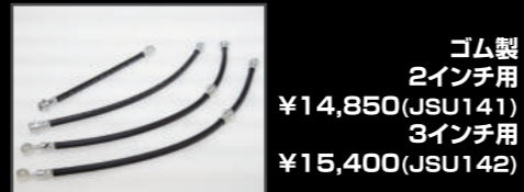
ゴム製 2インチ用 ¥14,850(JSU141) 3インチ用 ¥15,400(JSU142)