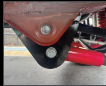
リーディングダウンブラケット ¥29,700(JSU143)