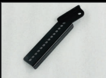
オートレベライザー補正ステー スチール製 ¥3,300(JSU136) XC、JC、ノマドグレードでリフトアップした際の必需品