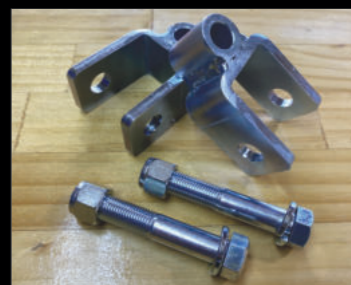
リア ショック延長ブラケット 70mm ¥12,000/2個(JSU166) 50mm ¥11,000/2個(JSU167)