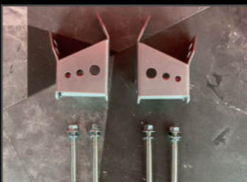
メンバークリアランスブラケット 2~3インチ対応 ¥11,880(JSU135) リフトアップ時のクロスメンバーとプロペラシャフトの干渉を防ぐブラケットです。