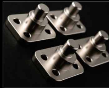
偏芯キングピン ¥41,800(JSU157) 純正キングピンを撤去し、上下に取り付けることで2度ネガティブキャンバーを実現しました。コーナリング中のフロントグリップを大きく向上させシムニーで異次元のコーナリングを楽しめます。