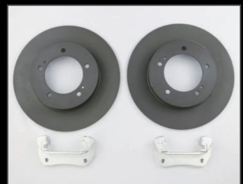
ビッグローターセット ¥54,780(JSU170) 純正より1インチ大きくすることにより、ブレーキの効きを向上させます。 セット内容 ブレーキローター本体 キャリパーブラケット