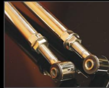
ステンレスラテラルロッド フロント/リア 各¥25,300 (JSU144) ステンレス製、調整式強化ラテラルロッド。