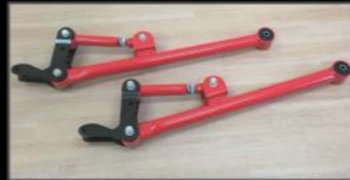
リアMOリンクキット ¥148,500 (JSU126) ホーシング側にブラケットを装着し、プッシュを片側4カ所にする事で、ストロークや捻じれは純正の比ではないくらい良く動く足に変身します。アッパーアームが調整式になっているため、コイルの弓なりも補正でき、乗り心地も良くなります。5リンクでは気になるロールやワインドアップも、このMOリンクでは気にならない程度です。