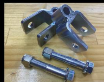
リア ショック延長ブラケット 70mm ¥13,200/2個 (JSU166) 50mm ¥11,000/2個 (JSU167)