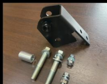
ラテラルアップブラケット ¥8,580 (JSU168)