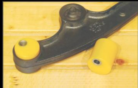
スペシャルキャスト 2個 ¥11,000 (JSU138) 偏心量大きいキャスト補正フッシュです。純正アームで2インチ以上リフトアップする際は偏心フッシュと交換をしキャスト角の補正をしましょう。