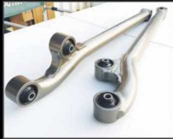
ZEROアーム フロント/リア各 ¥60,720 (JSU123)