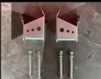
メンバークリアランスブラケット 2~3インチ対応 ¥11,880 (JSU135) リフトアップ時のクロスメンバーとプロペラシャフトの干渉を防ぐブラケットです。