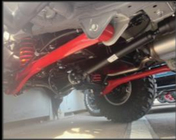
リアトレーリングアーム ¥60,720 (JSU125) 2インチ用~5インチ用まで設定あり