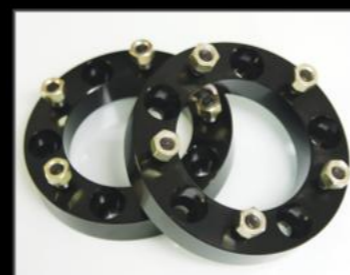
ワイドトレッドスパーサー PCD139.7 5H 2枚セット 20mm ¥11,000 (JSU158) 30mm ¥13,200 (JSU159) 40mm ¥14,300 (JSU160) 50mm ¥15,400 (JSU161) 60mm ¥16,500 (JSU162) 70mm ¥17,600 (JSU163)