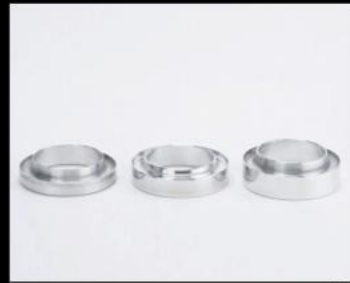
コイルスパーサー アルミ製 10mm ¥5,390/枚 (JSU148) 15mm ¥5,720/枚 (JSU149) 20mm ¥5,720/枚 (JSU150)