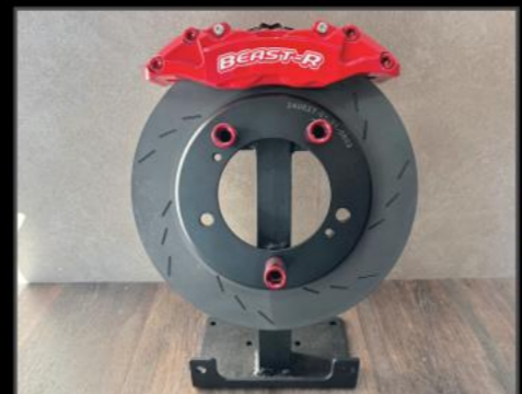
クラッシュ 4ポット キャリパー ビッグローター キット JB64/JB74/JC74 ¥275,000 (JSU169) ビーストアールオリジナルブレーキシステム。当社レースカーで過激なテストを繰り返したハイパフォーマンスブレーキシステムです。キャリパー部分のロゴは白/赤と黒/黄の2色より選択可能。