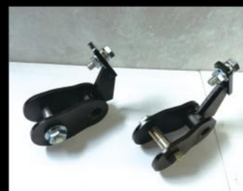
フロント ショック延長ブラケット 70mm ¥13,200/2個 (JSU164) 50mm ¥12,100/2個 (JSU165)