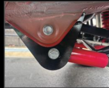
リーディングダウンブラケット ¥29,700 (JSU143)