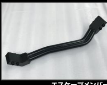
エスケープメンバー 3インチUP ¥24,200 (JSU132) 2インチUP ¥22,000 (JSU133) 車高アップした際の必需品。プロペラシャフトが当たらないメンバー。ダブルパイプ式で高強度。構造を工夫する事で地上高を下げず、オフロードも安心して走行できます。車検対応。脱着式のため構造変更不要。脱着式のメンバーですが外すと車検には通りません。スチール、半つや消しブラック塗装。