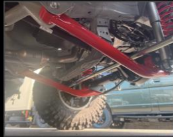
フロントリーディングアーム ¥60,720 (JSU124) 2インチ用~5インチ用まで設定あり