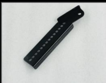
オートレベライザー補正ステー スチール製 ¥3,300 (JSU136) XC、JC、ノマドグレードでリフトアップした際の必需品