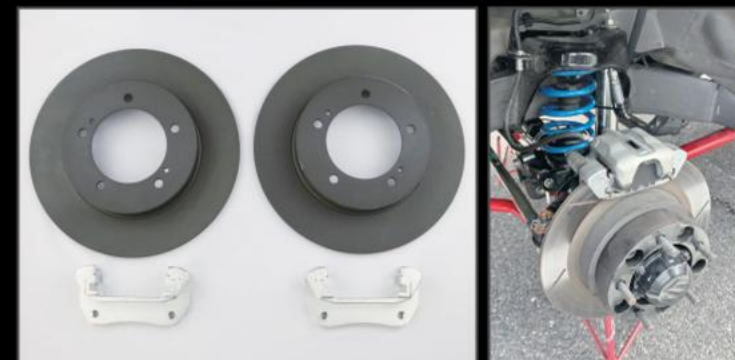
ビッグローターセット ¥54,780 (JSU170) 純正より1インチ大きくすることにより、ブレーキの効きを向上させます。 セット内容 ブレーキローター本体 キャリパーブラケット