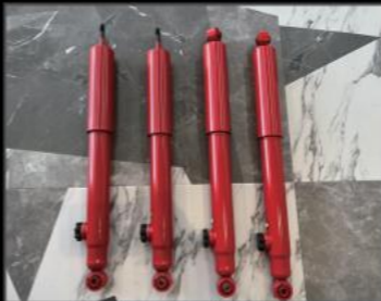
14段階調整式ショック 3インチ ¥88,000 (JSU130) 2インチ ¥83,600 (JSU131)

JB64/74特有のピッチングやロールを完全に解消しながらなめらかな乗り心地のよさを両立したダンパーセットです。ノーマルスプリングとの相性も良いです。