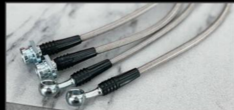
ステンレスブレーキホース ステンレス製 2インチ用 ¥17,600 (JSU139) 3インチ用 ¥18,700 (JSU140)