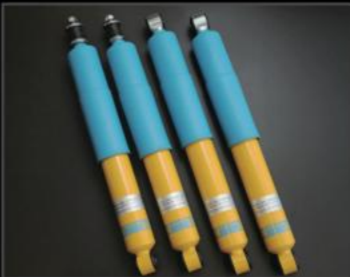
ビルシュタイン JB64用 ¥117,700 (JSU128) JB74用 ¥126,500 (JSU129)

MONROE社製。基本性能と低価格を両立させたショックアブソーバー。フロント/リア共に純正ショックに対し、伸び側の減衰を多少強めているが、縮み側は純正よりも、ふたまわり大きいピストンバルブ(30Φ)を採用する事により腰砕けせず、しっかりした乗り味を実現しています。