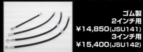
ゴム製 2インチ用 ¥14,850 (JSU141) 3インチ用 ¥15,400 (JSU142)