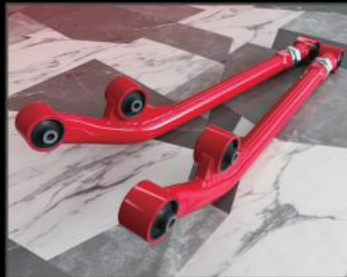
調整式フロントリーディングアーム 3インチ用 ¥69,300 (JSU156) 4インチ用 ¥71,500 (JSU157)