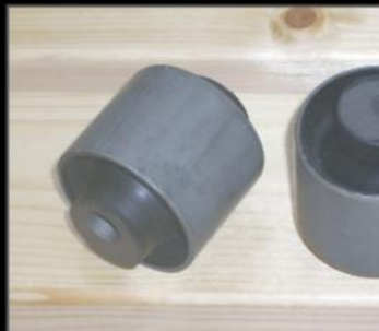
キャストーフッシュ 2個 ¥8,800 (JSU137) 純正アームのフッシュと交換することで角度補正を行います。コイルの弓なりを改善します。