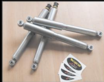
モンロー・ロードマチック 2インチ/3インチ用 ¥60,060 (JSU127)

MONROE社製。基本性能と低価格を両立させたショックアブソーバー。フロント/リア共に純正ショックに対し、伸び側の減衰を多少強めているが、縮み側は純正よりも、ふたまわり大きいピストンバルブ(30Φ)を採用する事により腰砕けせず、しっかりした乗り味を実現しています。