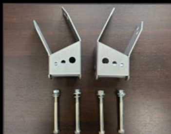
メンバークリアランスブラケット 4~5インチ対応 ¥15,950 (JSU134) リフトアップ時のクロスメンバーとプロペラシャフトの干渉を防ぐブラケットです。