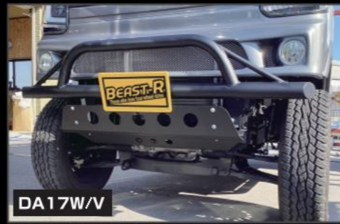
DA17W/V スチールアンダーガード(取付ステー付き) ¥30,800 (EE031)