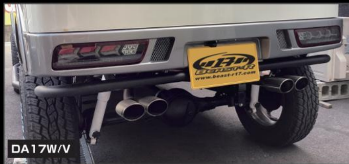
DA17W/V ちょい悪4本出しマフラー DA17ターボ用 ノーマルバンパー用(競技用) ¥66,000 (EE034) SSリアバンパーに装着の場合はバンパーとマフラーの間が少し開きます。別途、衝突防止バンパーType-K/Type-Wを装着して頂くと、クリアランスが埋まり見た目も良くなります。