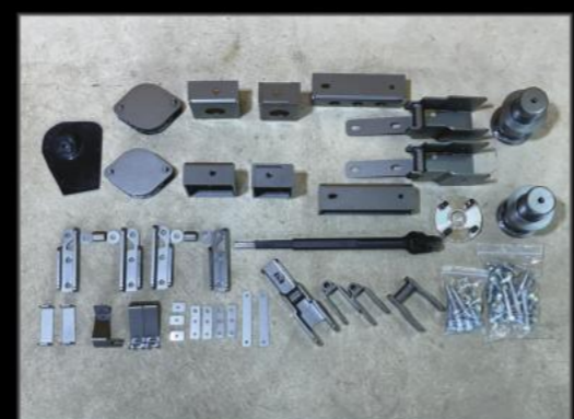
4インチスタンダードキット DA17W/V ¥148,500 (ESU054) マフラー吊りゴム3個セット ¥11,000 (ESU050) 4WDは別途フロントプロペラシャフトスペーサー ¥13,200 (ESU051)

キット内容 リフトアップブロックキット リアプロペラシャフトスペーサー リアショック延長ブラケット 各種延長ステー ロングステアリングシャフト ※ステアリングシャフトはコア要返却です。 返却無しの場合は別途¥13,200