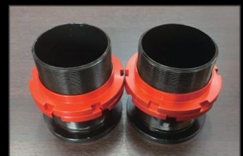
リアスプリングアジャスター ¥33,000 (ESU055) 純正スプリングからピストアール5.5インチコイルまで使用可能なアジャスターです。ネジ式調整式で、約20ミリから55ミリほどのリフトアップが可能。

キット内容 リフトアップブロックキット リアプロペラシャフトスペーサー リアショック延長ブラケット 各種延長ステー ロングステアリングシャフト ※ステアリングシャフトはコア要返却です。 返却無しの場合は別途¥13,200