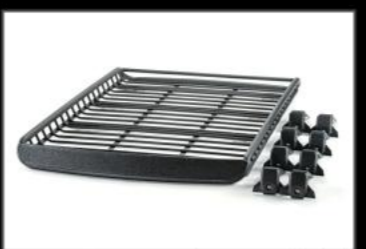
ルーフラックA-X LLサイズ フット付き 標準ルーフ用 ¥89,650 (EE045) アルミ製