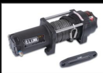
ウィンチ6000Lbs シーエルリンク ¥42,350 (EE048) ファイバーロープ 総重量10kg