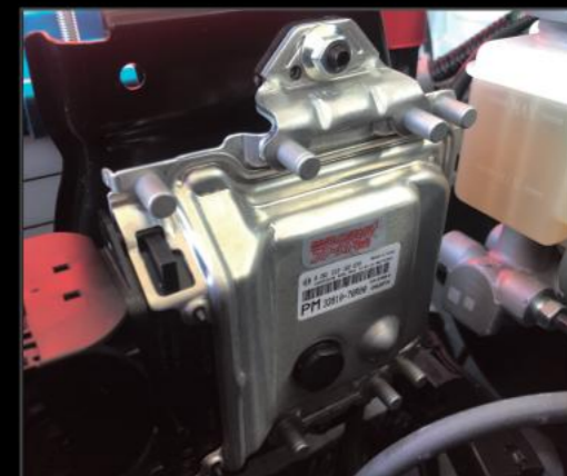
ハイスpekコンピュータクレバー DA17W1~6型対応 ¥96,800 (ESU057)

40ミリアップスプリング 調整式ラテラルロッド リア延長ブラケット キャンバーボルト