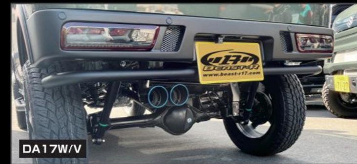
DA17W/V COLBASSO DA17ターボ用 (rossomodella)ノーマルバンパー用 チタンテール ¥79,200 (EE035) ステンレステール ¥75,900 (EE036) 片側2本出しマフラー 車検対応 BEAST-ROゴ入り