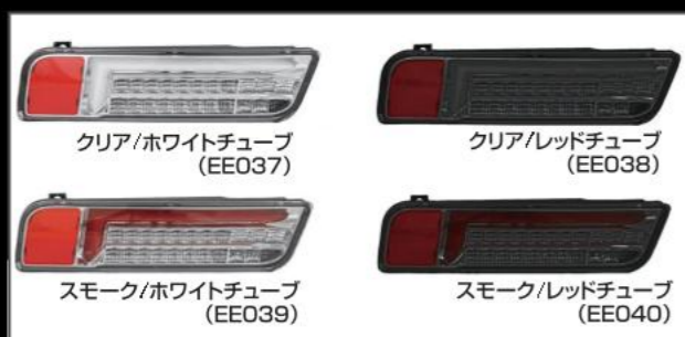
SSリア専用LEDテールランプ(M-BRO) ¥38,500 クリア/ホワイトチューブ (EE037) クリア/レッドチューブ (EE038) スモーク/ホワイトチューブ (EE039) スモーク/レッドチューブ (EE040)