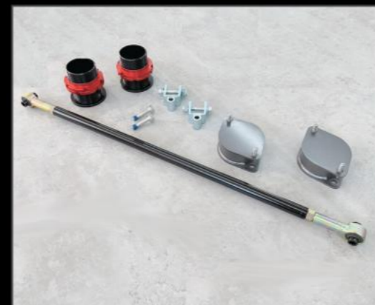
40ミリアップキット DA17W/V ¥78,650 (ESU056)

40ミリアップスプリング 調整式ラテラルロッド リア延長ブラケット キャンバーボルト