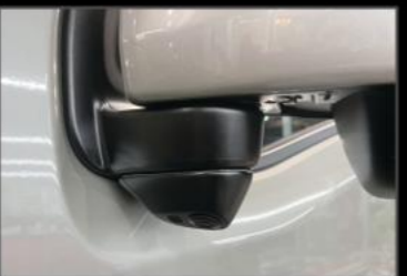
ハイマウントバックカメラ ¥29,700 (EE083)