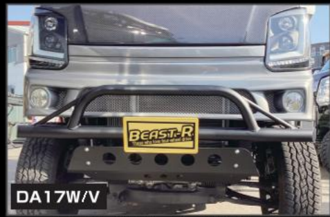
DA17W/V フロントバンパーガード(取付ステー付き) ¥60,500 (EE030)