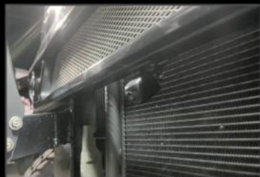
車検対応カメラ ¥62,700 (EE042) フロントカメラ、サイドカメラ、モニター、スイッチャーのセットです。リフトアップ車の車検、直前直左対策に必要です。