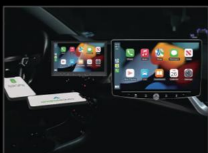
ディスプレイオーディオ 配線込み(TV付き) 8インチ ¥126,500 (EE043) 10インチ ¥135,300 (EE044)