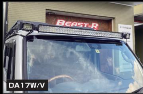
DA17W/V 42インチLEDライトバーフルセット ¥53,900 (EE032) 小型ワークライト2個付き ボディ用保護フィルム ¥1,100 (EE033)