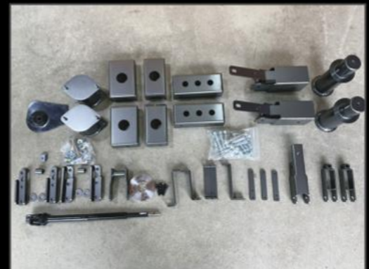
6インチスタンダードキット DA17W/V ¥198,000 (ESU052) マフラー吊りゴム3個セット ¥11,000 (ESU050) 4WDは別途フロントプロペラシャフトスペーサー ¥13,200 (ESU051)

キット内容 リフトアップブロックキット リアプロペラシャフトスペーサー リアショック延長ブラケット 各種延長ステー ロングステアリングシャフト ※ステアリングシャフトはコア要返却です。 返却無しの場合は別途¥13,200