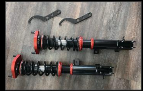
フロント全調式車高調整キット ¥165,000 (ESU053) 直巻きスプリング使用でバネレート3k~を自由に選択できます。2インチアップから5インチアップまで対応。リフトアップブロックと併用で更にリフトアップが可能になります。

キット内容 リフトアップブロックキット リアプロペラシャフトスペーサー リアショック延長ブラケット 各種延長ステー ロングステアリングシャフト ※ステアリングシャフトはコア要返却です。 返却無しの場合は別途¥13,200