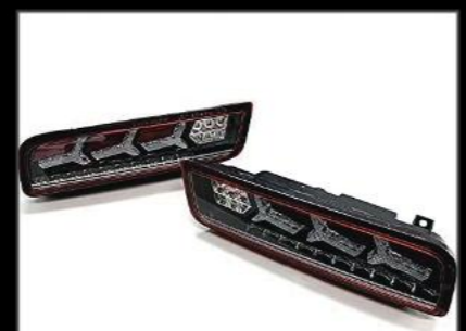
SS専用LEDテールランプ(idaten) ¥39,930 (EE041) レッド&クリアレンズ/クリスタルバンパー車検対応