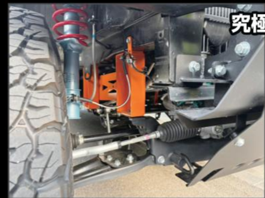
7インチスペシャルキット DA17W/V ¥523,600 (ESU049) マフラー吊りゴム3個セット ¥11,000 (ESU050) 4WDは別途フロントプロペラシャフトスペーサー ¥13,200 (ESU051)