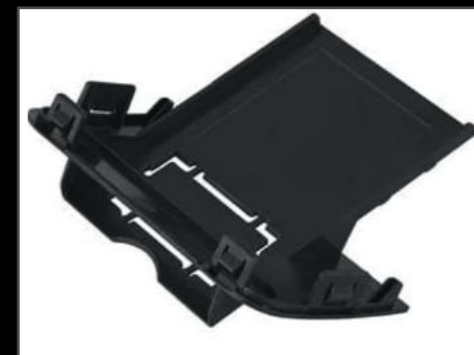
ETCステア DA17W/V ¥3,850 (EIN081)