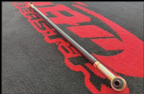
リア調整式ラテラルロッド DA17W/V ¥19,800 (ESU061) リフトアップで車高が変わった際の車輻のスレを補正します。