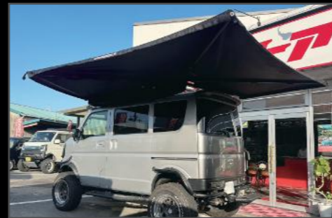
270度サイドオーニング 2m ¥140,800 (EIN075) サイズ:15 x 207 x 17cm(閉じた状態) 重量:19.5kg