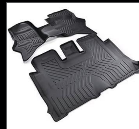
3Dラバーフロアマット DA17W/V ¥19,800 (EIN079)