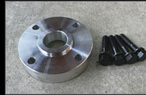
プロペラシャフトスペーサー DA17W/V フロント ¥13,200 (ESU067) リア ¥13,750 (ESU068) リフトアップ時のプロペラシャフト抜けを防止します。4WDの場合はフロント、リア共に必要ホルトセット