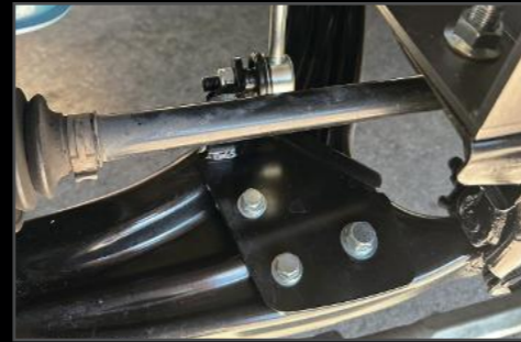
フロントスタビライザー移設キット DA17W/V ¥21,780 (ESU060) 純正はストラットにスタビリンクが付いております。ロアアームに移設することでダイレクトにスタビライザーが効き、ふらつきを押さえます。