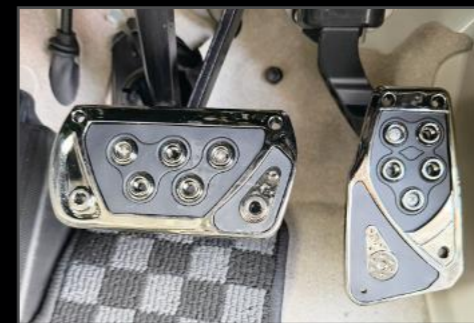
ペダルセット ¥9,350 (EIN078)