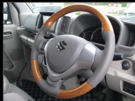
コンビハンドル ¥33,000 (EIN080) カラーブラック、黒木目、茶木目、黄木目