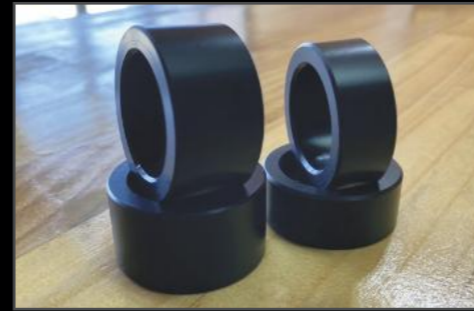
ステアリングストッパー DA17W/V ¥11,000 (ESU066) タイヤを大径化するとタイヤハウス内側が干渉します。ステアリングストッパーで切れ角を制限することで、干渉を防ぎます。