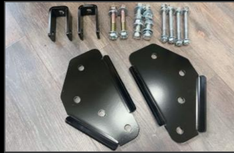
リアショック移設ブラケット DA17W/V ¥20,570 (ESU059) リアショックのアッパー側の取付位置を車両後方にずらすことにより、乗り心地の向上します。2か所穴が空いております。ショック調に合わせてお使いください。4インチリフトアップ以上の車輻に適合。