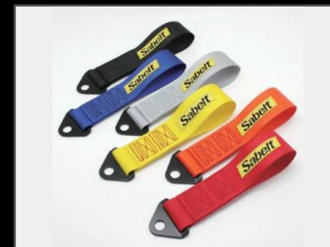
牽引ストラップ ¥5500 (EIN082) リアゲート内側に取り付けて開めるときのアシストとしてお使い頂けます。