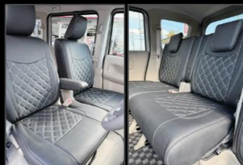
レザー調シートカバー ¥25,300 (EIN077)