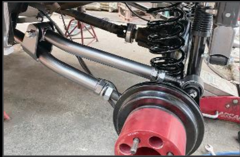
リアリンク DA17W/V ¥118,800 (ESU058) リフトアップ時に生じるホーシングの角度によるプロペラシャフトの音なり軽減、スプリングシートの角度調整により乗り心地向上の他ホイールベース適正化も図れる優れたものです。