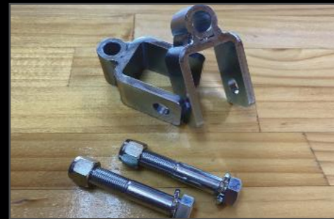
リアショック延長ブラケット DA17W/V ¥4,620 (ESU063) 純正リアショックを使いリフトアップをする場合、ショック調が足りません。こちらの商品を使うと50mm延長することが可能