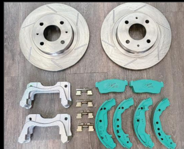
15インチ対応ビッグローターキット ¥99,000 (ESU065) ノーマルのブレーキでは物足りなさを感じますが、純正ローターより大径化することによりブレーキの効きを向上させます。パッドも交換することにより、制動力が更にアップします。