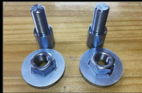
フロントショック延長ボルト DA17W/V ¥10,560 (ESU062) 純正ストラット式ショックを延長出来るボルトセット。純正ストラットに35mm、40mmアプスプリングを入れるにはこちらの商品が必要