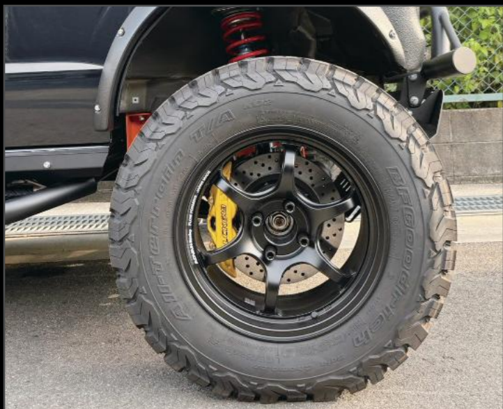
4PODブレーキキャリパービッグローターキット ¥220,000 (ESU064) アルミ削り出し4PODキャリパー。大径タイヤでもしっかり効くブレーキ性能。ドレスアップ効果も抜群です。カラーはレッド、イエロー、グレー ※15インチ以上のホイールに適合します。