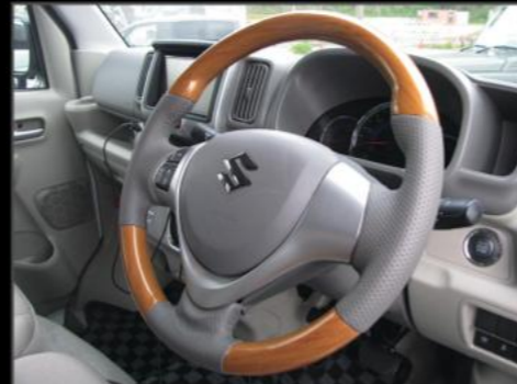
コンビハンドル ¥33,000 (EIN080) カラーブラック、黒木目、茶木目、黄木目