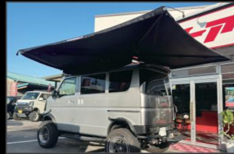
270度サイドオーニング 2m ¥140,800 (EIN075) サイズ:15 x 207 x 17cm(閉じた状態) 重量:19.5kg