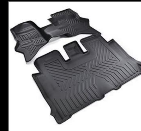
3Dラバーフロアマット DA17W/V ¥19,800 (EIN079)