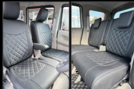
レザー調シートカバー ¥25,300 (EIN077)