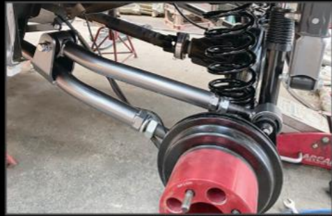
リアリンク DA17W/V ¥118,800 (ESU058) リフトアップ時に生じるホーシングの角度によるプロペラシャフトの音なり軽減、スプリングシートの角度調整により乗り心地向上の他ホイールベース適正化も図れる優れたものです。