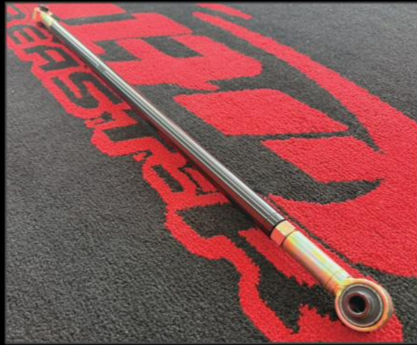
リア調整式ラテラルロッド DA17W/V ¥19,800 (ESU061) リフトアップで車高が変わった際の車軸のスレを補正します。