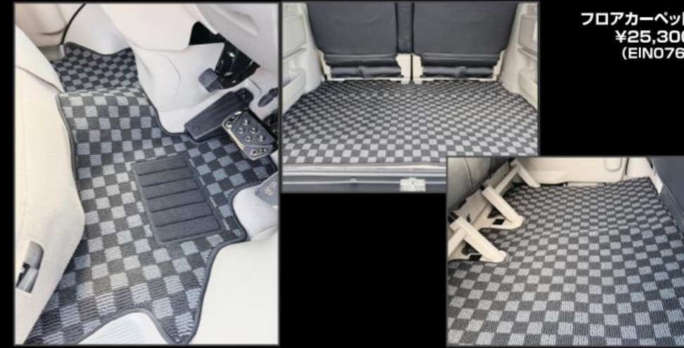
フロアカーペット ¥25,300 (EIN076)