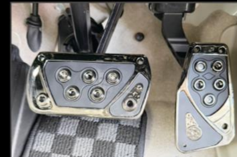
ペダルセット ¥9,350 (EIN078)