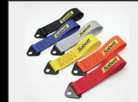
牽引ストラップ ¥5,500 (EIN082) リアゲート内側に取付けて閉めるときのアシストとしてお使い頂けます。