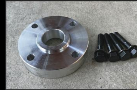
プロペラシャフトスペーサー DA17W/V フロント ¥13,200 (ESU067) リア ¥13,750 (ESU068) リフトアップ時のプロペラシャフト抜けを防止します。4WDの場合はフロント、リア共に必要ホルトセット