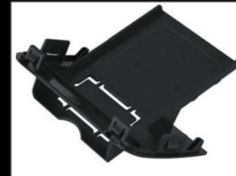
ETCステッカー DA17W/V ¥3,850 (EIN081)