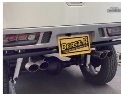
ちょい悪4本出しマフラー ノーマルバンパー用(競技用) ¥66,000

衝突防止バンパー装着時用。 4本出しならではのリフトアップには パッチリのリアビューを作り出してくれる アイテムです。