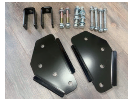
リアショック移設ブラケット ¥18,700

リフトアップ時に生じるホーシングの 角度によるプロペラシャフトの音なり 軽減、スプリングシートの角度調整に より乗り心地向上の他ホイールベース 適正化も図れる優れものです。