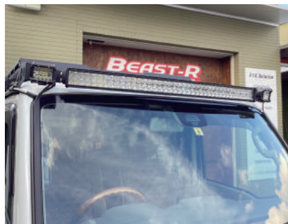
42インチLEDライトバースターSET ¥38,170 小型ワークライト付きフルSET ¥49,170 ボディ用保護フィルム ¥1,100