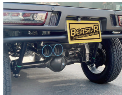
COLBASSO ターボ用(ロッソモデル) ノーマルバンパー用 Ti-C チタンテール ¥79,200 GT-X ステンレステール ¥75,900

衝突防止バンパー装着時用。 4本出しならではのリフトアップには パッチリのリアビューを作り出してくれる アイテムです。