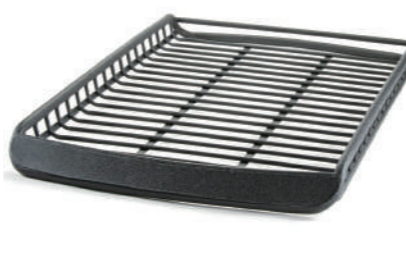
ルーフラックA-X LLサイズ ハイルーフ用 ¥105,600 ベースキャリア (TERZO) ¥39,600