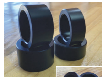
ステアリングストッパー ¥11,000