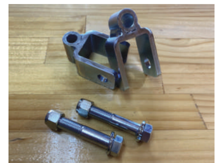
リア延長ブラケット リアショック延長ブラケット ¥3,850

フロントにリフトアップスプリング装着時、 伸び側の長さを延長して乗り心地向上の 為に必要なアイテムです。