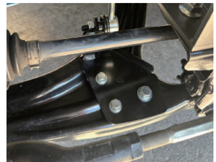
フロントスタビライザー移設キット ¥19,800

ショック位置を変更することで、 社外ショック交換時の干渉を防ぎます。 乗り心地向上、リアからのドレスアップ効果 (4インチリフトアップ以上の車両に適用)