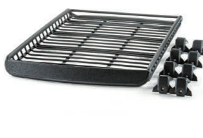
ルーフラックA-X LLサイズ フット付き 標準ルーフ用 ¥89,650