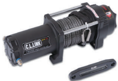
ウインチ6000lbs ファイバーロープ シーエルリンク ¥42,350

スタビリンクをショートにすることにより、 本来のスタビライザーの役目である 左右のロールをダイレクトに止める 優れものです