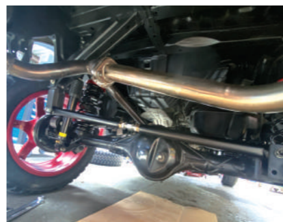
リア調整式ラテラルロッド ¥16,500