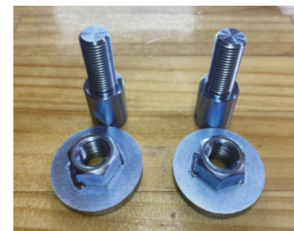
フロントショック延長ボルト ¥8,800

フロントにリフトアップスプリング装着時、 伸び側の長さを延長して乗り心地向上の 為に必要なアイテムです。